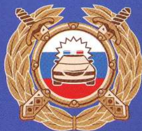
Госавтоинспекция МВД России